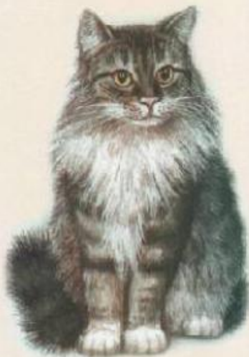
Иллюстрация В. М. Короткова

Вот какой коташка, Круглая мордашка, И на каждой лапке Коготки-царапки. Всё ему игрушки — Кубик и катушка. Котик точно мячик По квартире скачет.