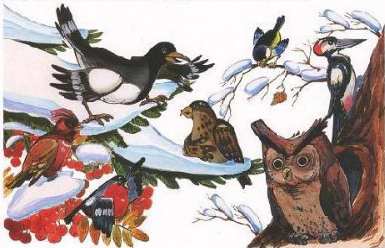
Иллюстрация М. Н. Раженцева

■ Развивая зрительное восприятие и внимание ребенка, предложите ему сравнить две иллюстрации к сказке «Как сойка клеста судила» и найти пять различий.