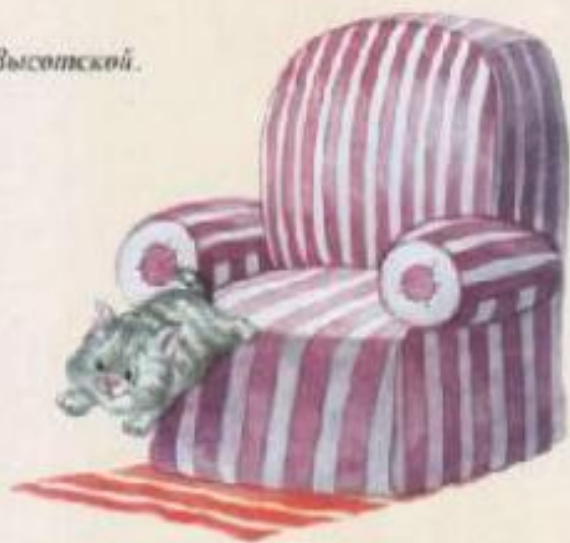
Иллюстрация И. А. Семенова